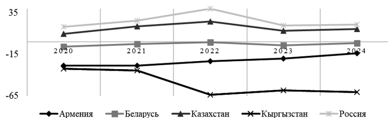
Рис. 1. Оценка уровня внутриотраслевой международной специализации стран ЕАЭС за 2020–2024 гг., %

Расчет коэффициента внутриотраслевой международной специализации стран ЕАЭС показал, что в Армении данный показатель в 2020 г. составил -28,6\% , в 2021 г. — (-28,6) , в 2022 г. — (-23,4) , в 2023 г. — (-19,8) , в 2024 г. — (-13,8\%) . Подчеркнем, что в Армении динамика по анализируемому