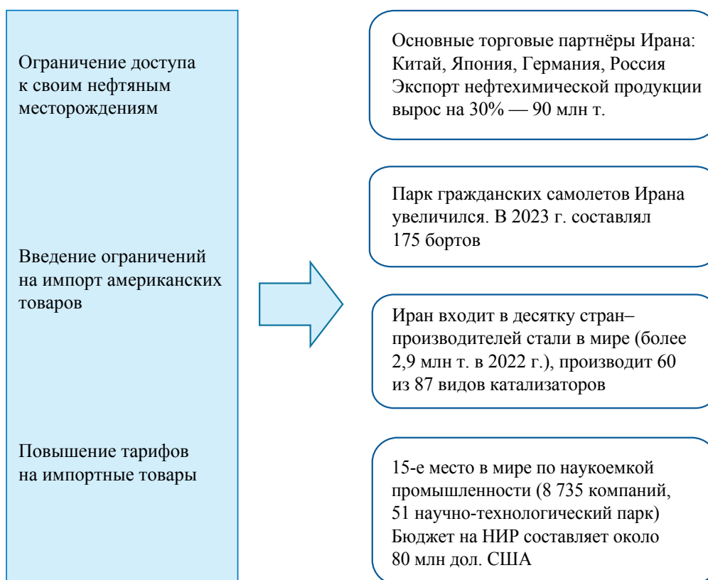
Рис. 1. Контрсанкционные меры Ирана и положительные изменения, составлен авторами [8–10]