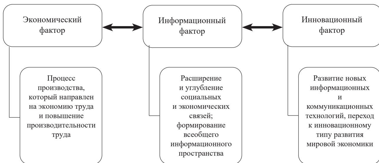
Рис. 2. Факторы, влияющие на процесс ускорения социализации экономики

Существует много факторов, которые способствуют ускорению процесса социализации экономики. К наиболее весомым можно отнести следующие: экономические, информационные и инновационные (рис. 2).