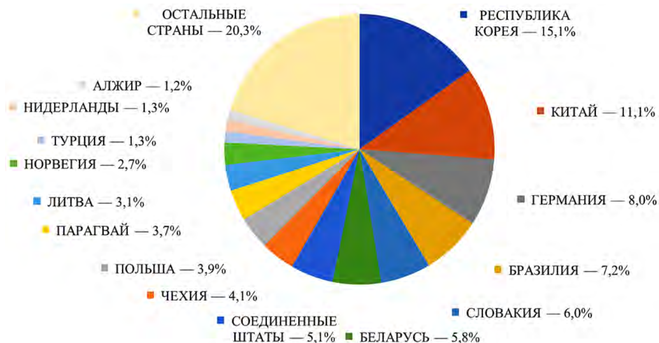
Рис. 2. Распределение внешнеторгового оборота Калининградской области по странам-контрагентам в 2020 г. [5]

Одной из основных причин глобальной нестабильности и проявления кризисных явлений как в мировой, так и в отечественной экономике стало введение карантинных мероприятий, вызванных развитием заболеваемости COVID-19. Объявление локдауна во многих странах мира обусловило временный полный или частичный отказ от привычных условий торговли, выбор более сдержанных форматов внешней торговли, формирование