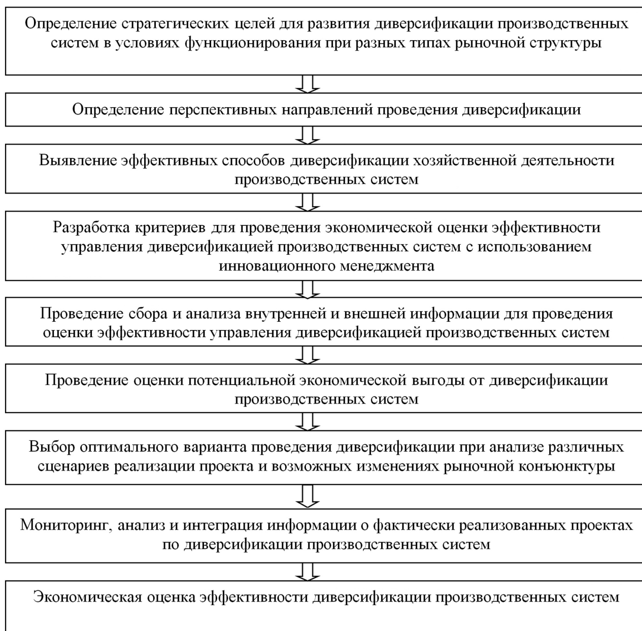
Рис. 4. Этапы оценки экономической эффективности диверсификации производственных систем (разработан авторами)

и опытом, формированию в экономической системе предпосылок для качественного роста производительности труда, снижению и перераспределению инновационных рисков, что весьма актуально при реализации рискованных инновационных проектов, требующих привлечения значительных инвестиций.