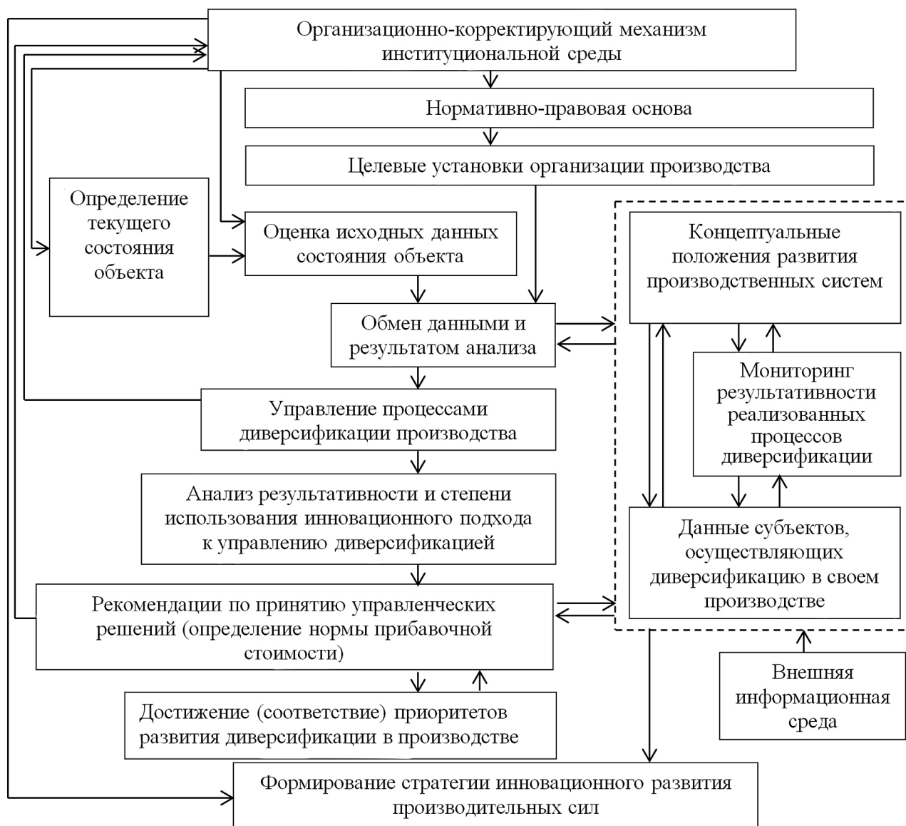
Рис. 3. Структура принятия управленческого решения по стимулированию процессов диверсификации деятельности в рыночных производственных системах (разработан авторами)

с необходимостью дополнительного вовлечения в хозяйственный кругооборот труда, земли и капитала. В этой связи заслуживает внимания процесс проведения оценки и экономического обоснования перспективных направлений диверсификации производственных систем с учетом конкретного типа рыночной структуры (рис. 4).