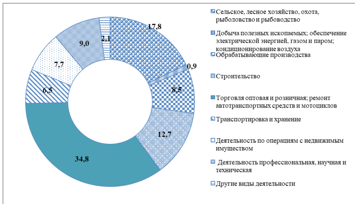
Рис. 1. Доля предприятий по видам экономической деятельности на конец 2018 г., %

динамика отмечена по отношению к апрелю 2018 г.