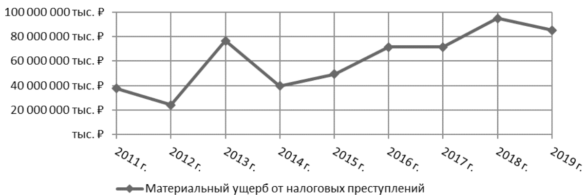
Рис. 3. Динамика размера материального ущерба от налоговых преступлений (составлен авторами)

2019 г. В 2017 г. доля материального ущерба от налоговых преступлений по отношению к размеру ущерба от всех экономических преступлений имеет схожее значение, как и в 2013 г., однако сам размер материального ущерба от налоговых преступлений фактически не изменился по сравнению с предыдущим годом. Доля размера материального ущерба от налоговых преступлений уменьшилась с 23 до 19%.