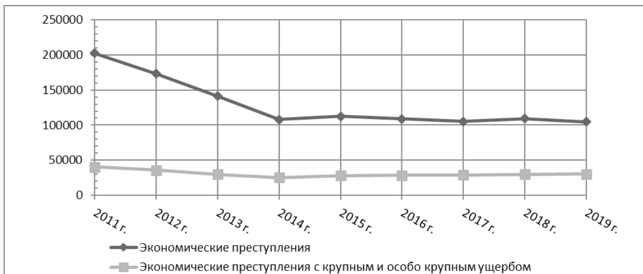
Рис. 1. Динамика всех экономических преступлений и экономических преступлений с крупным и особо крупным ущербом (составлен авторами)