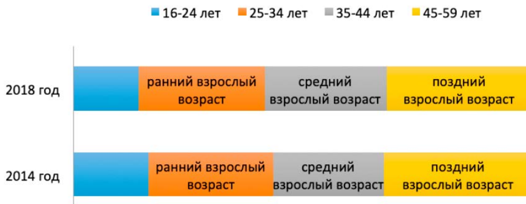
Рис. 2. Возрастная композиция населения Липецкой области в трудоспособном возрасте в соответствии с возрастной классификацией ВОЗ, 2014–2018 гг., на начало года, %

ее доля в численности населения рабочего возраста снизилась с 16,4 до 14,3%. Такие изменения в численности «довзрослой» когорты населения региона рабочего возраста являются прямым следствием резкого падения региональной рождаемости в 1995–2000 гг. Так, если в 1990 г. число родившихся в области составило 11,2‰, то в 2000 г. – 7,4‰, что является самым низким значением региональной рождаемости в постперестроечном периоде. Увеличение показателей рождаемости в Липецкой области начинается только с 2004 г. [3, с. 166].