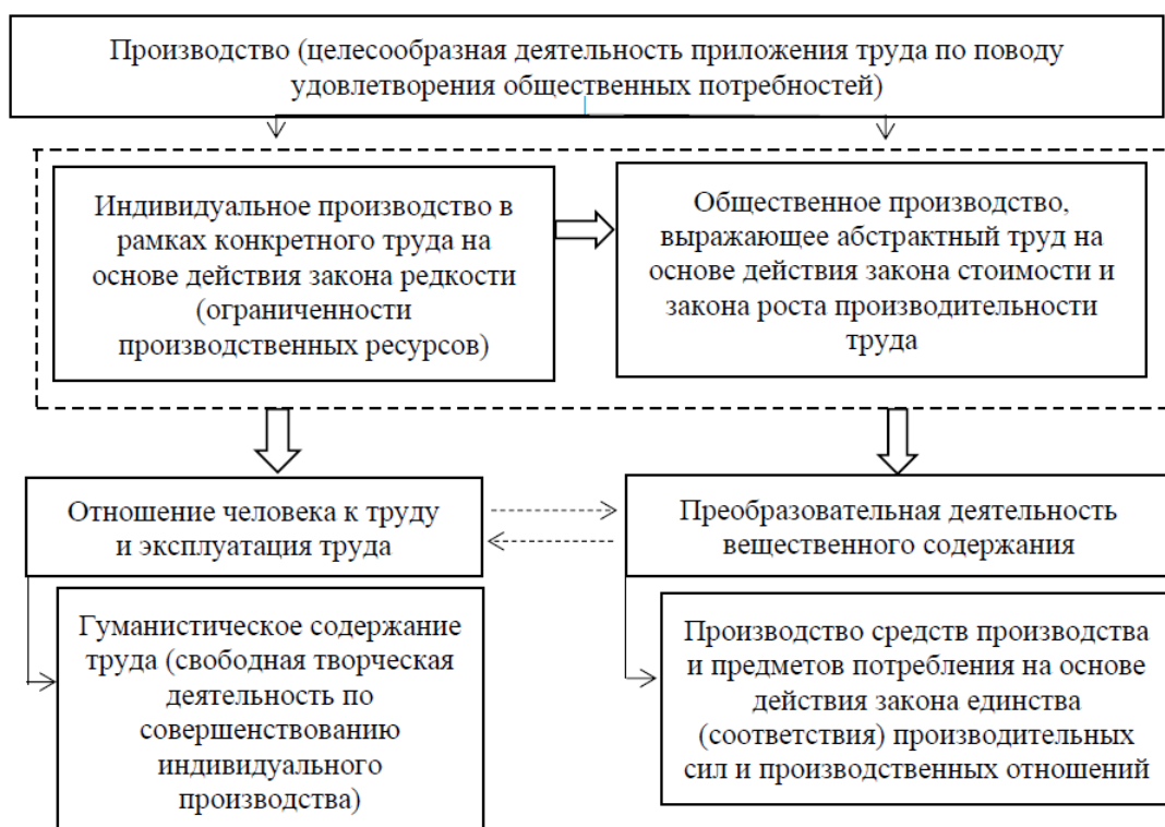
Рис. 1. Содержательная трактовка понятия «производство»

Согласно марксистской трактовке гуманистический подход в понимании производства,