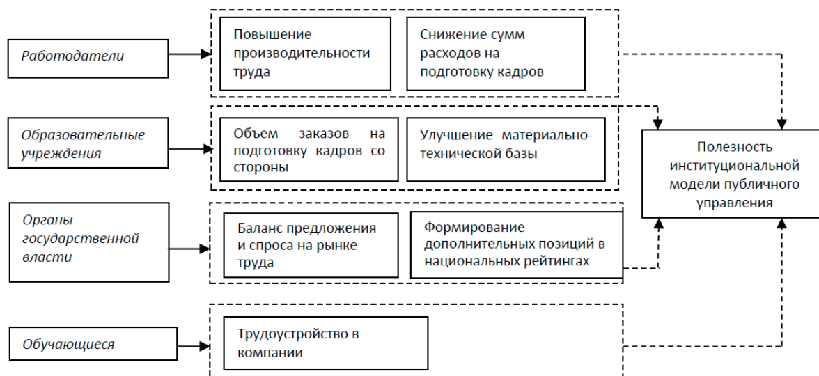
Рис. 1. Схема выбора институциональной модели публичного управления в рамках институционально-компетентностного подхода

Предложенная модель практически лишена дополнительных институциональных надстроек, что позволяет снизить издержки на ее внедрение. При создании в регионе модели публичного управления трудовыми ресурсами в рамках институционально-компетентностного подхода, состоящей только из категорий постоянных участников, предполагает высокую нагрузку при выполнении функций, взятых на себя компаниями-партнерами и учебными заведениями. Данная схема взаимодействия предполагает, что обе стороны будут инвестировать значительные временные и материальные ресурсы, соответственно,