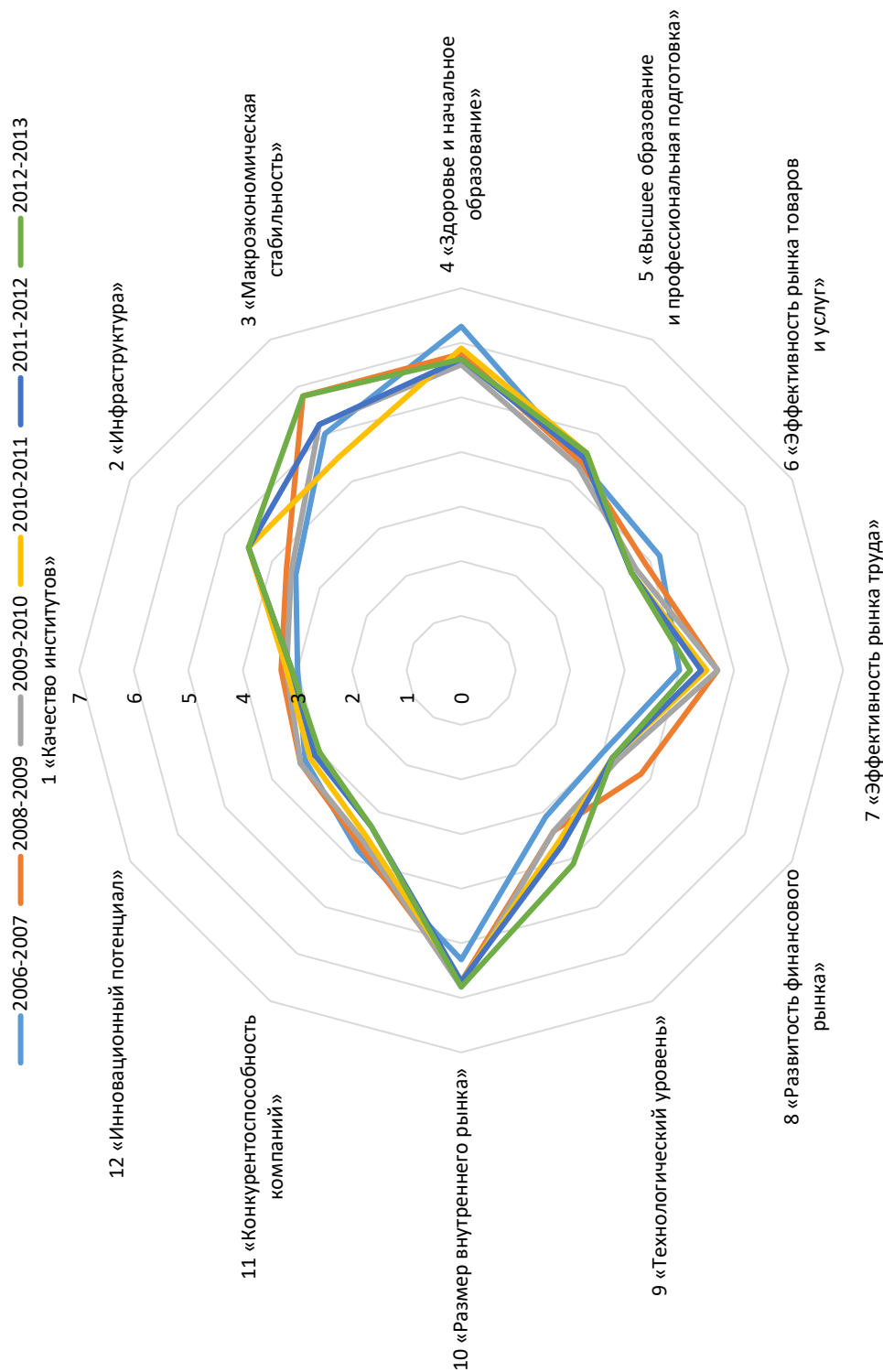
Рис. 2. Значение критериев индекса конкурентоспособности России в 2006–2013 гг. (по материалам [17])