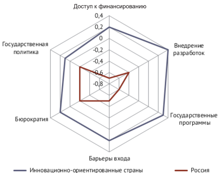
Рис. 1. Институциональные факторы, воздействующие на развитие предпринимательства в России и инновационно ориентированных странах (по материалам [1])