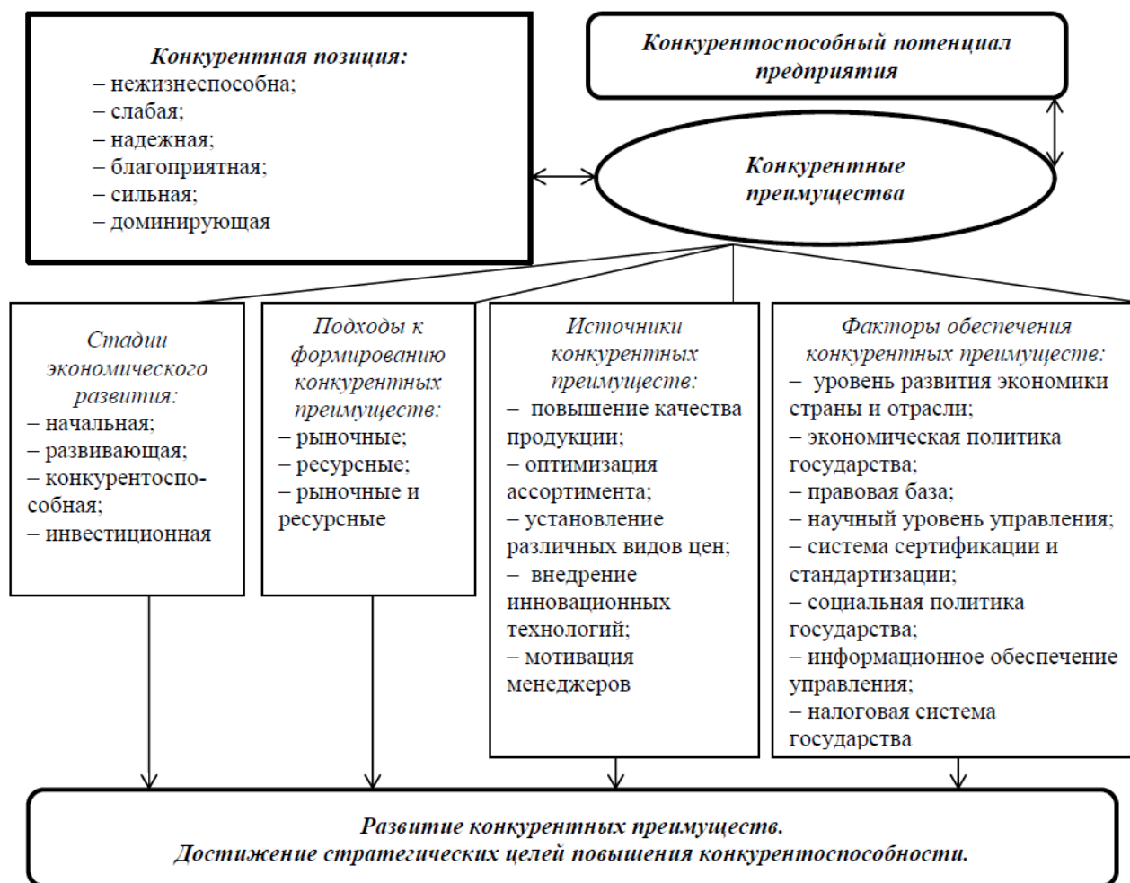
Рис. 1. Взаимосвязь категорий теории конкурентоспособности предприятия в рыночных условиях

Проводить оценку влияния некоторых внешних и внутренних факторов на процесс