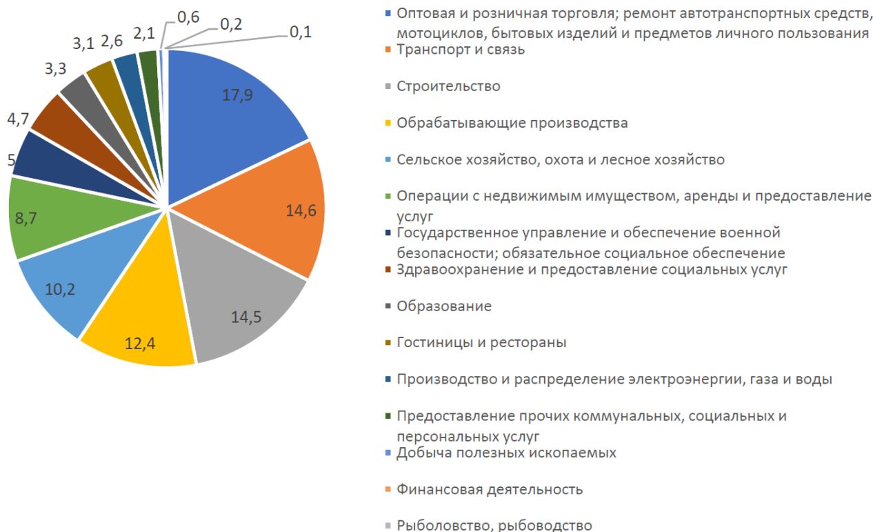
Рис. 2. Отраслевая структура валовой добавленной стоимости в Краснодарском крае 2014 г., % к итогу [7]

Для наиболее точного определения тенденций развития МСП в регионе целесообразно для начала провести анализ валовой добавленной стоимости (ВДС) по секторам экономики в Краснодарском крае. Отраслевая структура ВДС по состоянию на 2014 г. (наиболее свежие данные) выглядит следующим образом (рис. 2).