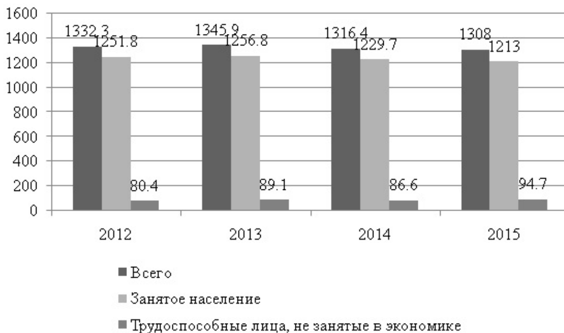
Рис. 1. Численность рабочей силы Волгоградской области в 2012–2015 гг. (тыс. чел.) [7]