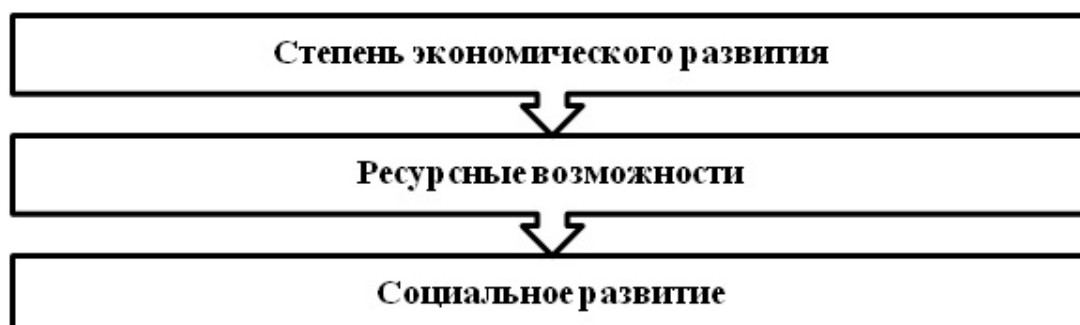
Рис. 4. Зависимость показателей социально-экономического развития региона.

– социальная ответственность бизнеса, заключающаяся в реализации следующих мероприятий: обеспечение широким социальным