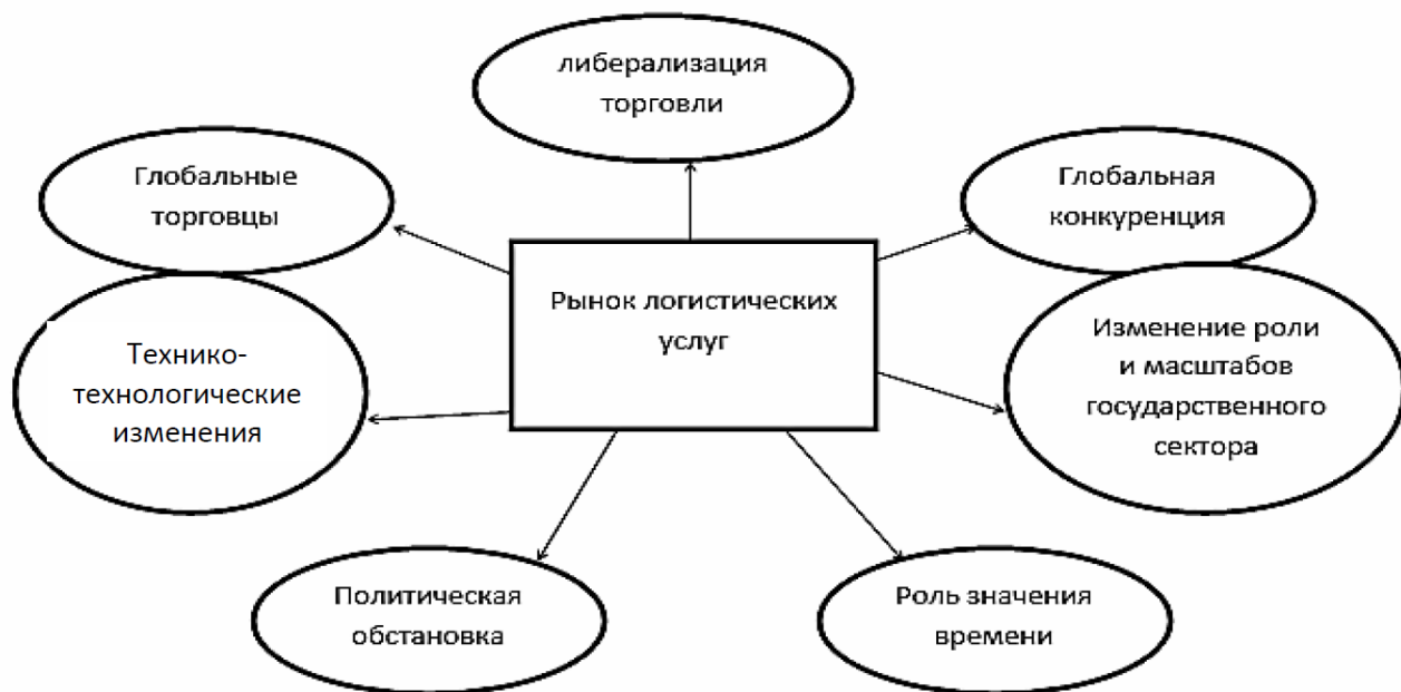
Рис. 1. Логистика под влиянием нескольких аспектов (выполнен авторами по [2])