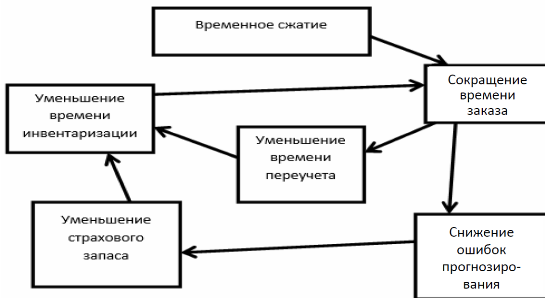
Рис. 2. Временное сжатие «оптимального круга» (разработан авторами по [2])

Время, основанное на системе с акцентом на ускорение, приводит к снижению кумулятивных сроков, запасов и, таким образом, к дальнейшему сокращению времени отклика. Сжатие времени «оптимальный круг» выглядит следующим образом (рис. 2).