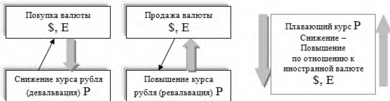
Рис. 1. Валютные интервенции, проводимые Банком России ($ – доллар США, Е – евро, Р – рубль, национальная валюта)

На рис. 1 графически отражены валютные интервенции, проводимые Банком России ($ – доллар США, Е – евро, Р – рубль, национальная валюта)