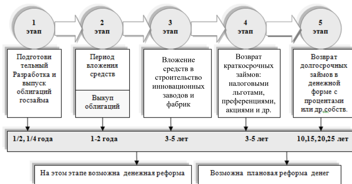
Рис. 6. Этапы выкупа и возврата займа по государственным облигациям, с возможной безболезненной денежной реформой (при возможной реформе денег владельцы облигаций государственного займа получают возврат равноценных номиналов денег в соотношении с их прежним уровнем жизни и дивидендами)

С авторской точки зрения, целесообразно действовать с помощью Правительственной комиссии и ее контроля, потому что ресурсный потенциал управления в масштабах страны здесь самый большой. Особенно показательно подчеркнуть, что облигационные накопления из зарубежных стран могут прийти не только в иностранной валюте, а золотом, дорогими и важными технологиями, высокотехнологическим оборудованием (конечно, в больших размерах) для строительства российской инновационной индустрии, по согласованию с Национальным центром финансового насыщения государства, Правительственной ко-