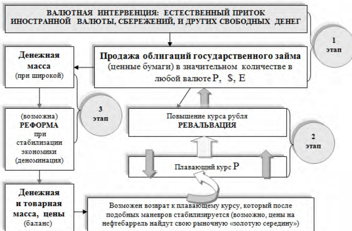
Рис. 2. Схема валютной интервенции по укреплению национальной валюты (естественный приток) (ревальвация (реставрация) – повышение металлического содержания денежных единиц или курса бумажных денежных знаков по отношению к металлу либо иностранной валюте; деноминация – укрупнение денежной единицы страны без изменения ее наименования, проводимое в целях облегчения денежного обращения и придания большей полноценности деньгам)

тъя фигура: плавающий курс национальной валюты, происходят курсовые изменения, повышение – изменение под воздействием нестабильности рынка.