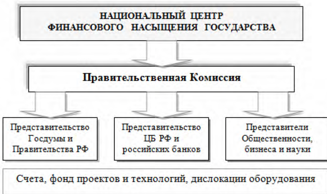
Рис. 4. Национальный центр финансового насыщения государства