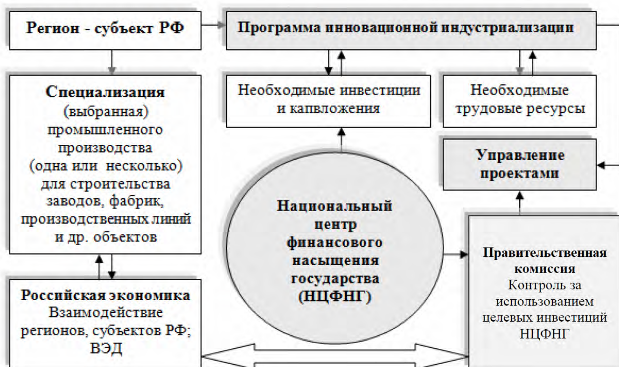
Рис. 7. Схема инновационно-индустриального развития региона (реиндустриализация)

Таким образом, опираясь на множество точек зрения и предложения ученых, целесообразно не только на международном, национальном, но и на региональном уровне