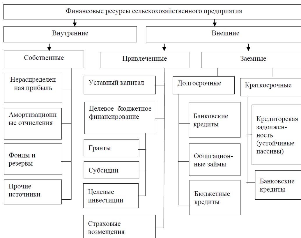
Рис. 1. Классификация финансовых ресурсов сельскохозяйственного предприятия по источникам формирования

В процессе своей деятельности сельскохозяйственные предприятия формируют финансовые ресурсы, привлекая и используя различные источники финансирования. Практика показывает, что каждый источник финансовых ресурсов предприятия АПК имеет специфические особенности, которые необходимо учитывать при планировании финансового обеспечения сельскохозяйственного производства. Обобщенная классификация финансовых ресурсов представлена на рис. 1.