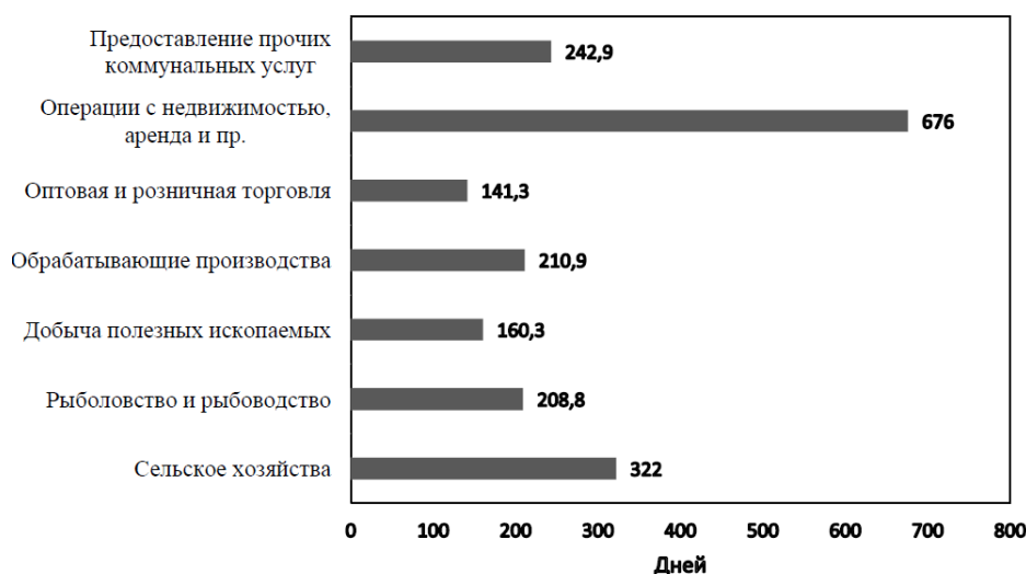
Рис. 2 Оборачиваемость оборотных активов за 2015 г. по основным отраслям (составлен авторами на основе данных [7])

высоких значений, уступая только отрасли по операциям с недвижимостью.