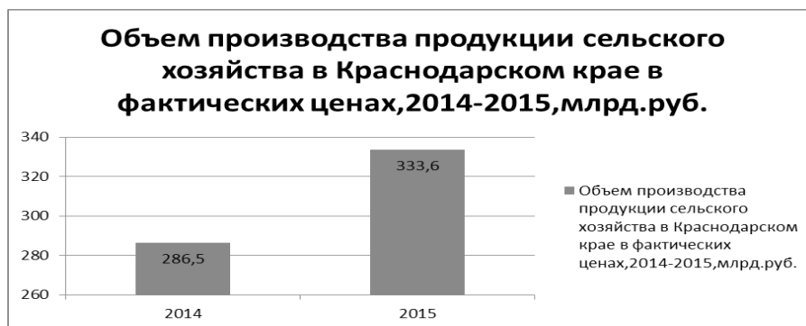
Рис. 2. Объем производства продукции сельского хозяйства в Краснодарском крае, 2014–2015 гг. (составлен авторами по [8])