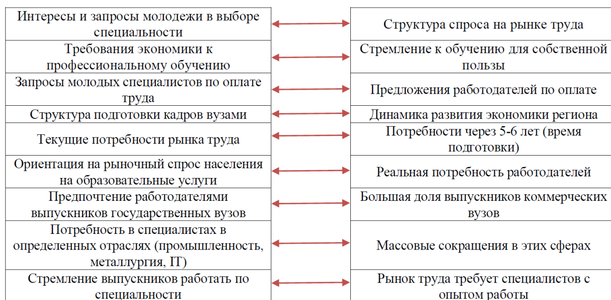
Рис. 1. Составляющие дисбаланса между спросом со стороны рынка труда и предложением рынка образовательных услуг

Полное интегрирование социальной и экономической эффективности высшего образования и соответствующая ему возможность высшей школы в удовлетворении как социальной, так и экономической потребности –